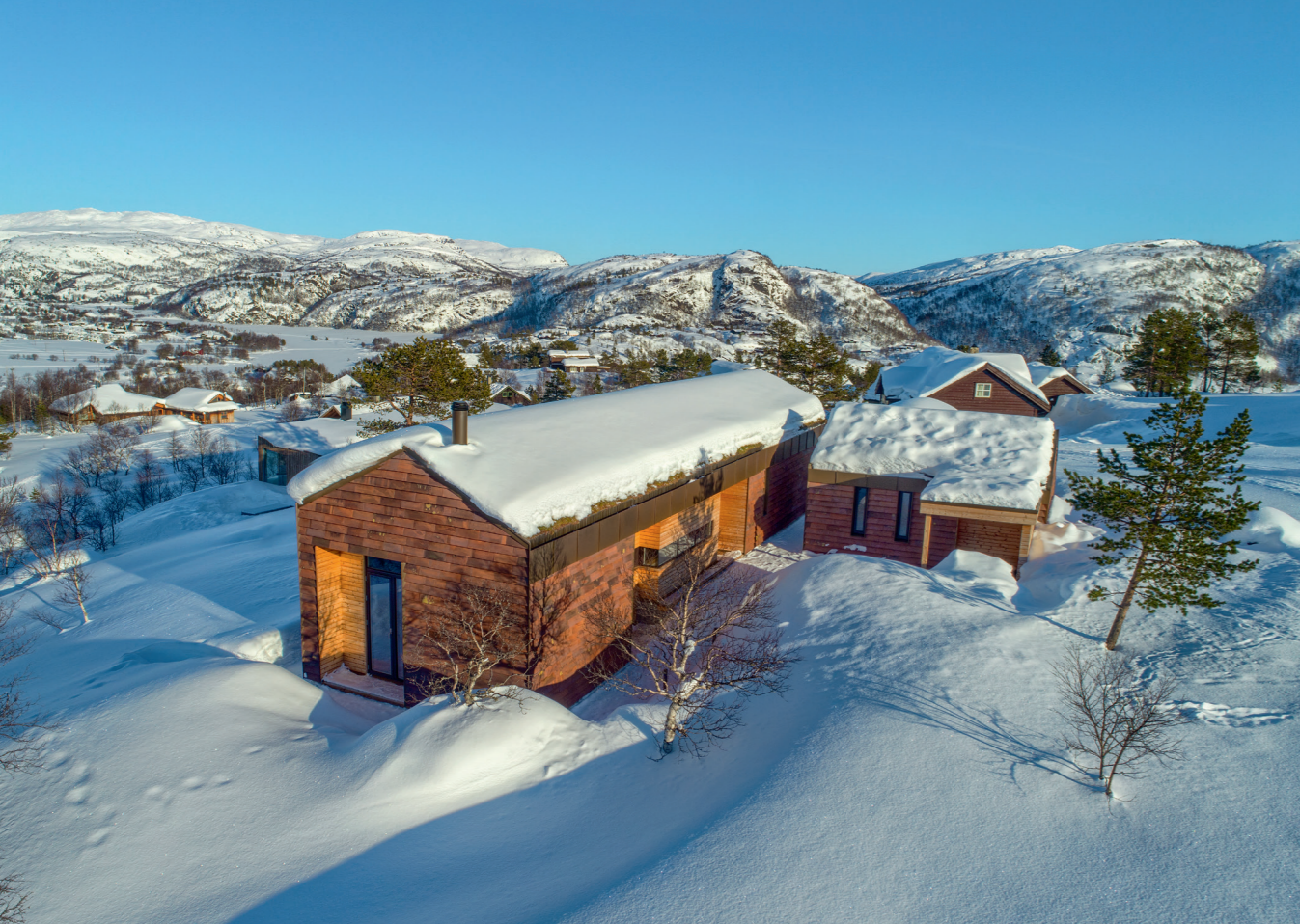
Norsk natur i snedragt. Hytten føjer sig til landskabet med udsigt over skiområdet Ålsheia cirka 100 km øst for Stavanger.