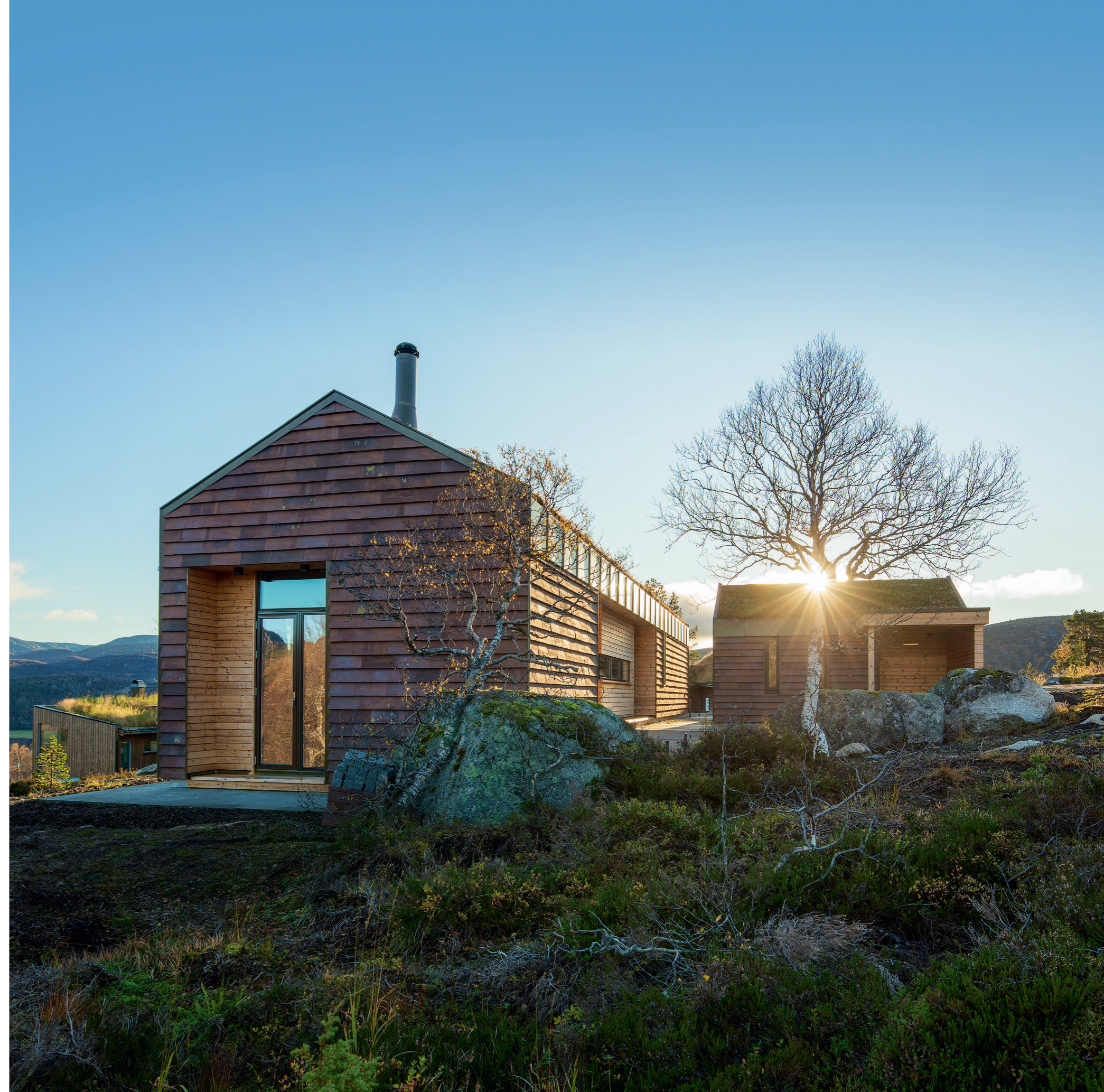
Grunden omkring hytten står uberørt med klipper og vegetation af birk og lyng. De mange rige nuancer i husenes teglbeklædning spiller smukt sammen med naturens farver.

Hytten rummer foruden et stort opholdsrum også to soverum og et badeværelse med sauna. I annekset er der to soverum og bad, mens udhuset giver plads til et værksted og til opbevaring af ski. Opholdsrummet i hytten har store panoramaruder mod nord, som trækker udsigten over dalen indenfor. De nordvendte vinduer giver et roligt og behageligt lys med bløde skygger. De mange vinduer tillader desuden brugen af mørke farver i interiøret. Loftet er beklædt med egetræ, gulvet er af poleret beton og væggene beklædt med brunbejdset træ. Stemningen er rustik og hyggelig. Et fald i terrænet gør det muligt at placere opholdsafdelingen med sofa og pejs 70 cm lavere end resten af hytten med ekstra loftshøjde til følge. Sofaen er placeret i en niche tæt op ad den murede pejs. »Her er der brugt Kolumbamursten i mørke-røde nuancer med mørke tilbageliggende fuger,« siger Hanne Kruse. »Den er ekstremt flot. Man får de her lange linjer.«