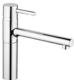
Bilde av Grohe Essence ettgrepsbatteri til kjøkken.