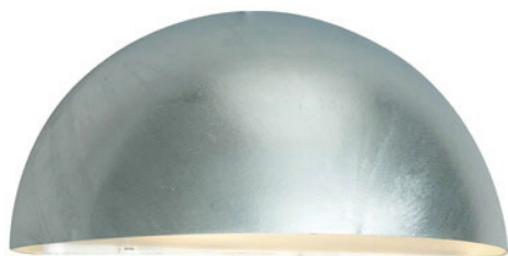
Bilde av utelys, type Norlys i galvanisert utførelse