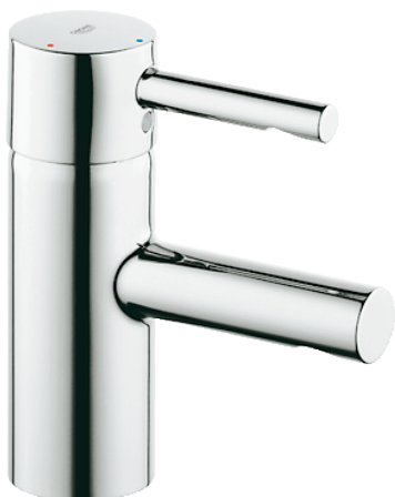
Bilde av Grohe Essence ettgrepssbatteri til servant.