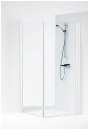
Bilde av Ifø Space 2000 rett dusjvegg.

Postadresse Luramyreveien 59 4313 Sandnes Telefon 926 51 041