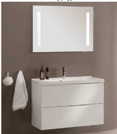
2 skuff baderomsmøbel fra Foss bad, hvit høyglans med Evermidte Surf servant

Postadresse Luramyveien 59 4313 Sandnes Telefon 926 51 041