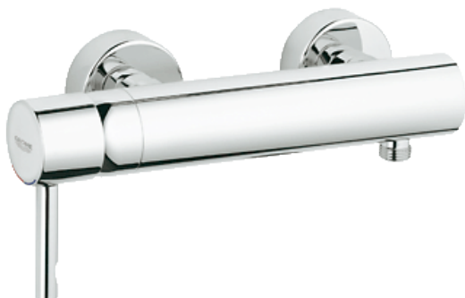
Bilde av Grohe Essence ettgrepsbatteri til dusj..